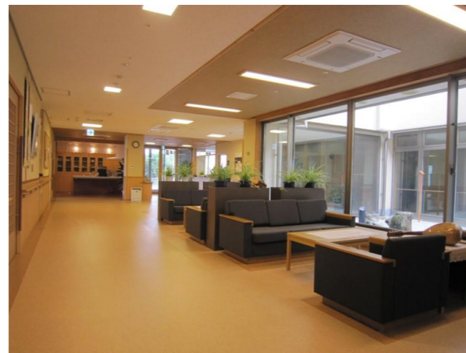
▲ホールより正面玄関を望む