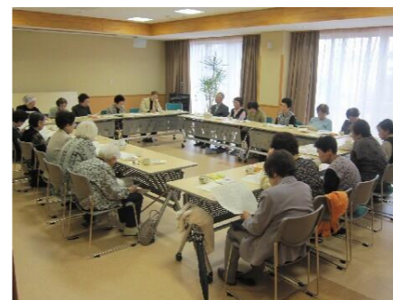
平成 24 年 5 月 15 日 菊の会